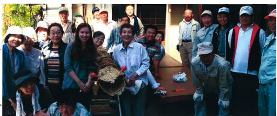
4月まで同志社大学で勉強します。(左から4人目)