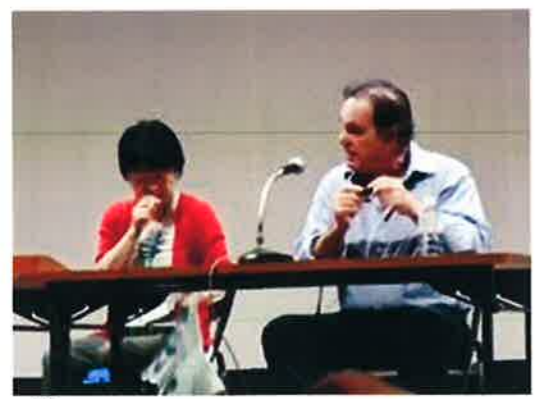
「7月4日に生まれて」「プラトーン」の米映画監督オリバーストンさんと討論

もと、大門まで薬 150 人が行進しました。暑い夏の日でした。沿道の人たちのお接待や、声掛けが大きな励ましになりました。いつまでも忘れません。平和の尊さ、命の尊厳