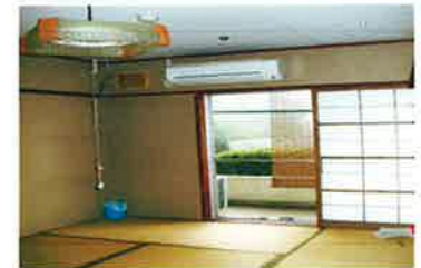
敬愛園の個室についたエアコン

酷暑の中、エアコンもない養護老人ホームは入所者の命をおびやかします。再三の要請と懇談の中、全室にエアコンが設置されました。これで安心して夏が過ごせます。